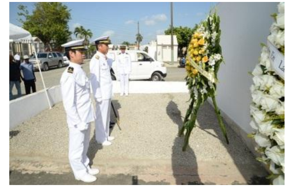
Ofrenda floral al Mausoleo de los inmigrantes japoneses, Cementerio Cristo Redentor