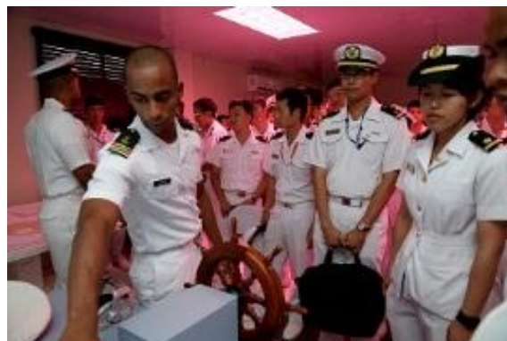
Visita a la Academia Naval