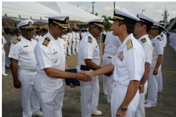
Ceremonia de Bienvenida Puerto Sansouci, Terminal Don Diego