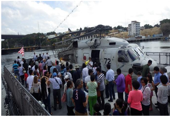
Exhibición especial del buque Yamagiri