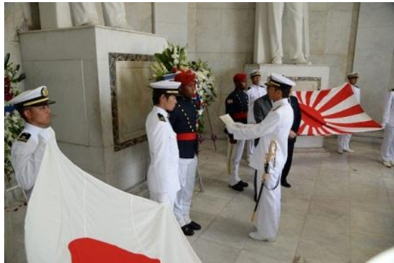
Ofrenda floral en el Altar de la Patria ofrecida por la Escuadra de Entrenamiento