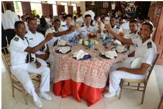
Almuerzo ofrecido por la Armada Dominicana