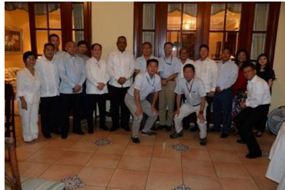
Cena ofrecida a militares japoneses