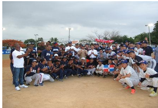
Intercambio deportivo (Softball) en el Play de la Armada de la República Dominicana