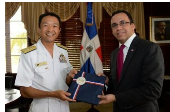
Visita al Excelentísimo Ministro de Relaciones Exteriores, Arq. Andrés Navarro