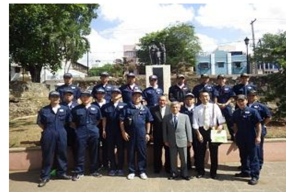
Limpieza realizada por voluntarios de la Autodefensa en el Monumento a la Inmigración Agrícola japonesa