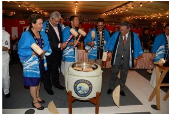
Recepción ofrecida a bordo del buque KASHIMA