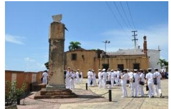
Excursión por la Zona Colonial