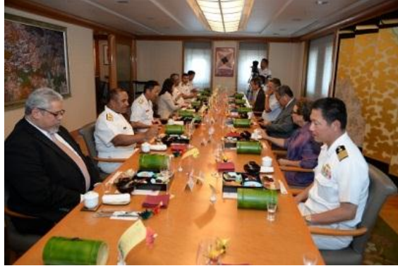
Almuerzo ofrecido por el Comandante de la Escuadra a bordo del Buque KASHIMA