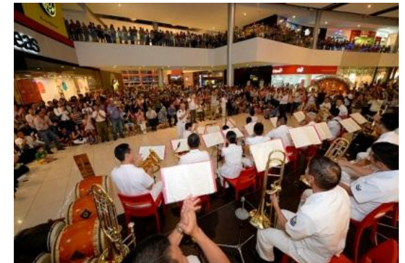
Concierto ofrecido por la Banda de Música de la Escuadra en la Plaza Comercial Galería 360